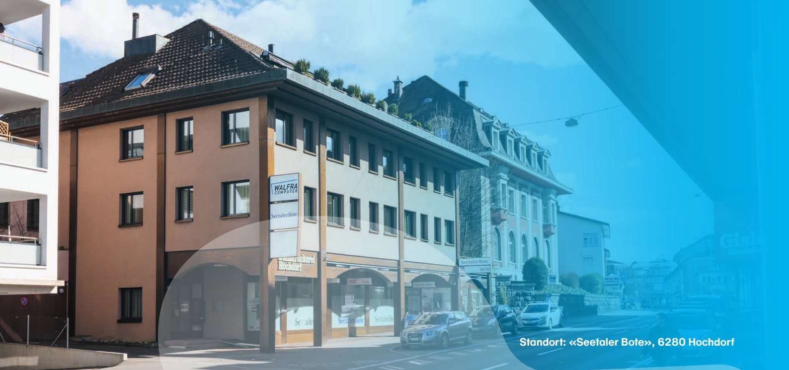
Standort: «Seetaler Bote», 6280 Hochdorf