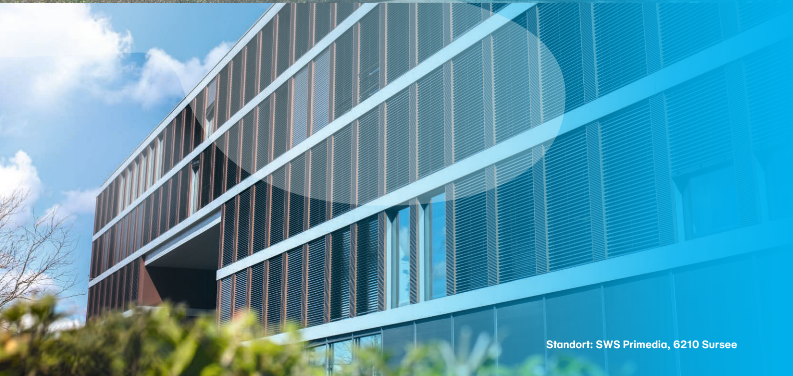
Standort: SWS Primedia, 6210 Sursee