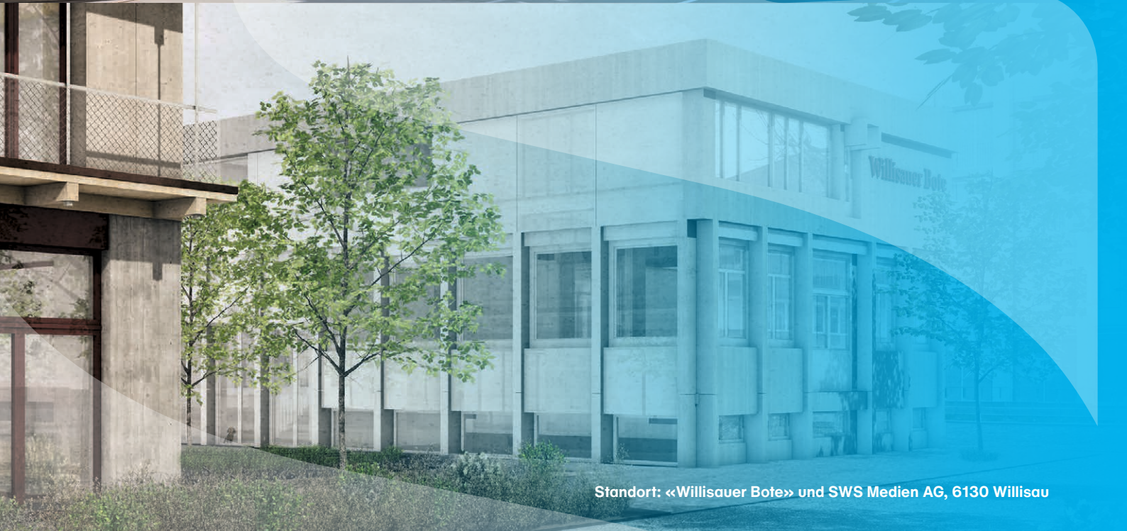
Standort: «Willisauer Bote» und SWS Medien AG, 6130 Willisau